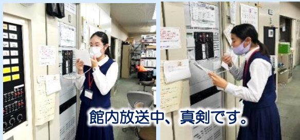
館内放送中、真剣です。

ジュニア司書はスタッフやプレイヤーとして参加しました。ゲームを始めるとみんなの心は一つになって楽しんでいました。また、開催してほしいとの声も聞かれました。