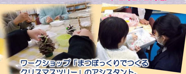
ワークショップ「まつぼっくりでつくる クリスマスツリー」のアシスタント。