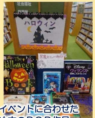
季節のイベントに合わせたおすすめ本のPOP作品