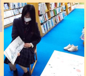
ツリーの接着剤が乾く までの間、絵本の読み 聞かせも行いました。