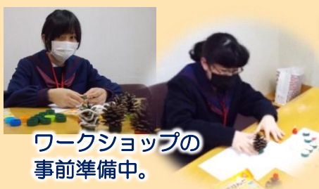
ワークショップの 事前準備中。