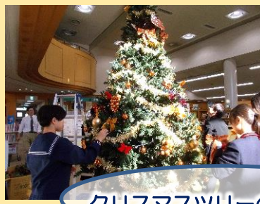
クリスマスツリーの飾りつけ