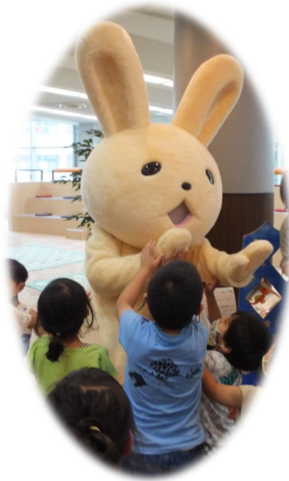
図書館マスコットキャラクター「よむらび」