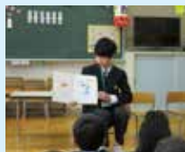
子ども司書によるおはなし会