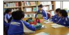
(学校図書館でグループ学習中)

三郷市内で中学校として初めて、早稲田中学校が読書活動優秀実践校の表彰を受けることになりました。早稲田中学校は、国語科の授業を中心として様々な読書活動を行ったり、国語科以外でも学校図書館活用の授業にも取り組んだりしています。さらに、中学生とシニア世代との交流読書会に取り組みんだり、分類表示のデザイン化作品に取り組んだりするなど、豊かな読書活動が推進されています。また、昨年度には、創立40周年記念事業として学校図書館の大改造も行われました。表彰式は4月23日子ども読書の日に国立オリンピック記念青少年総合センターで行われます。