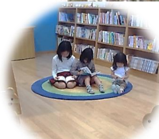
お子さんとのんびり過ごせる 読み聞かせコーナー