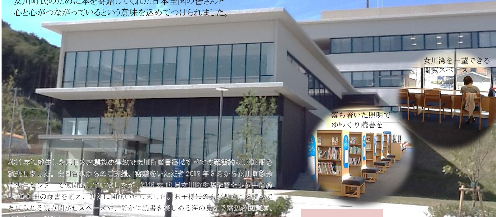
女川湾を一望できる 閲覧スペース

女川町生涯学習センター図書室の愛称である「女川つながる図書館」は女川町民のために本を寄贈してくれた日本全国の皆さんと心と心がつながっているという意味を込めてつけられました。