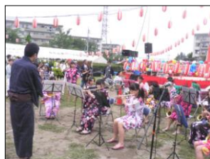
〈 浴衣姿で演奏 彦糸中吹奏楽部 〉

7月31日三郷団地12・13街区のグラウンドで「みさと納涼の夕べ」が開催されました。その中で、彦郷小学校ブラスバンド部・バトン部、彦糸中学校吹奏楽部・和太鼓で社会貢献部、社会人のオール・スウィング・ジャズオーケストラが参加し、東日本大震災復興応援チャリティコンサートがもたれました。「読書のまち三郷」から、本を被災地の学校に送りましょうと集められた義援金は、被災地の小学校に本にして贈られる予定です。