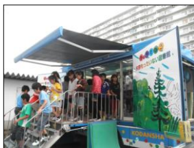
本のキャラバンカー