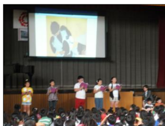
三郷の民話「こくぞうさまとうなぎ」を紹介する瑞木小の子どもたち