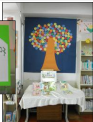
全児童読書目標の木