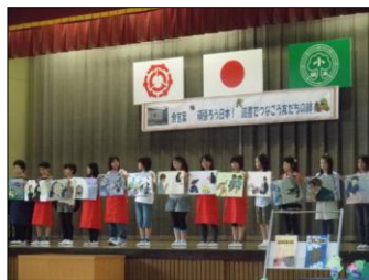
刺繍で作られた絵本「ちくちくおばあちゃん」を紹介する矢祭町の子どもたち

絵本や民話で交流しあって、楽しいひとときを過ごし、友情を育みました。なお、学校公開日ということもあり、大勢の保護者のみなさんも参加されていました。