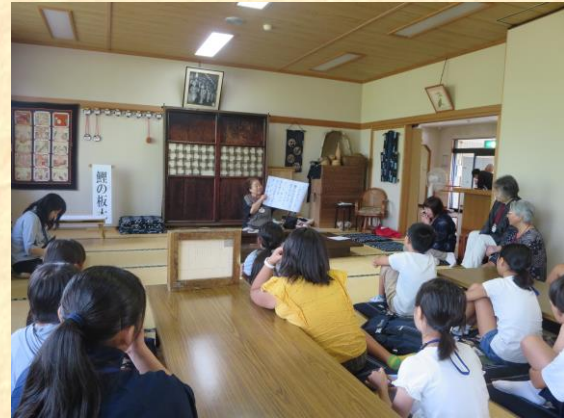
◎まりつきの歌を教えていただきました

紙芝居の読み方を練習し、グループごとに発表した後は方言についてご指導をしていただきました。