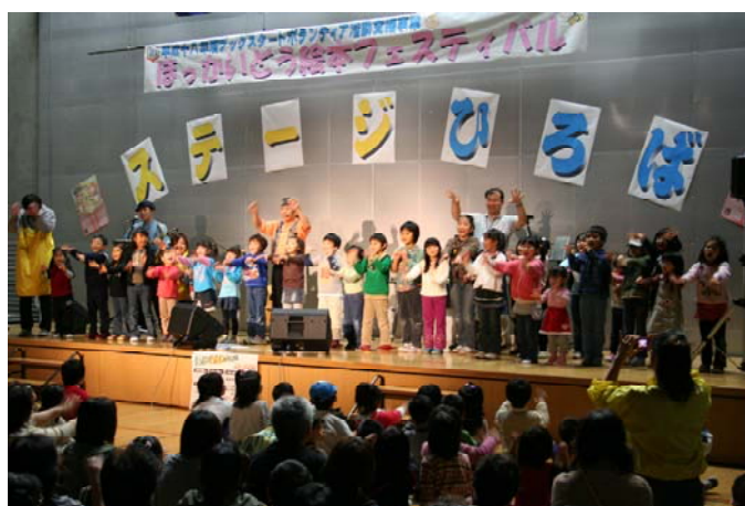
ほっかいどう絵本フェスティバル(道立青年の家) 〈平成18年度ブックスタートボランティア活動支援事業〉