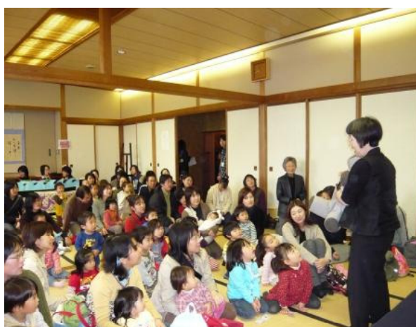
ほっかいどう絵本フェスティバル(白老町中央公民館) 〈平成19年度ブックスタートボランティア活動支援事業〉