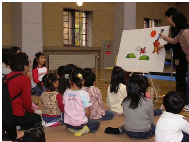
ほっかいどう絵本フェスティバル(森少年自然の家) 〈平成18年度ブックスタートボランティア活動支援事業〉