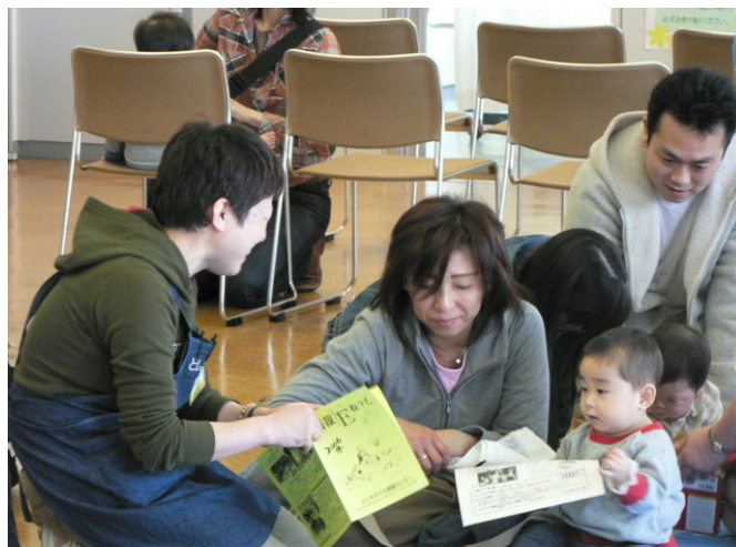
恵庭市ブックスタート事業