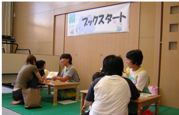
当別町ブックスタート推進事業