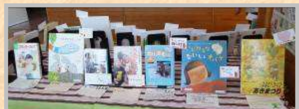
◎とても魅力的なコーナーが完成!