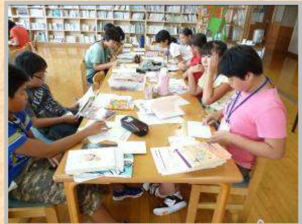
◎どんなものを作るのかな?