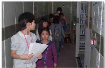
読書リーダーによる中央図書館 ひみつのちかしつたんけんツアー