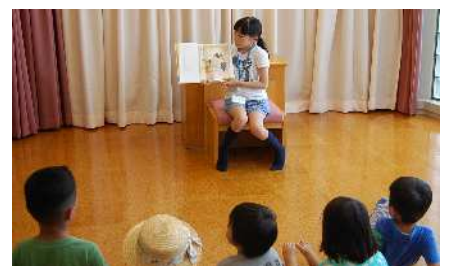
図書館でのドキドキの読み聞かせ体験

絵本について学び、図書館または保育園での「おはなし会」で、絵本の読み聞かせを体験します。