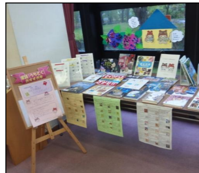
ちゅうおうとしよかんのようす

※「ちゅうおうとしよかん」と 「ひらたとしよセンター」には 「うちどくおすすめ本コーナー」 があります。 どんな本がいいのか、まよった ときには、ぜひどうぞ! おすすめ本リストもあります。