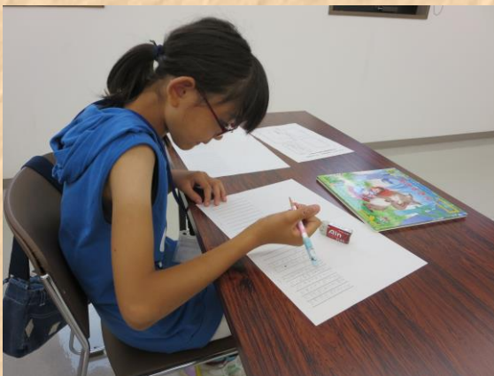
◎童話「あかずきん」を選びました