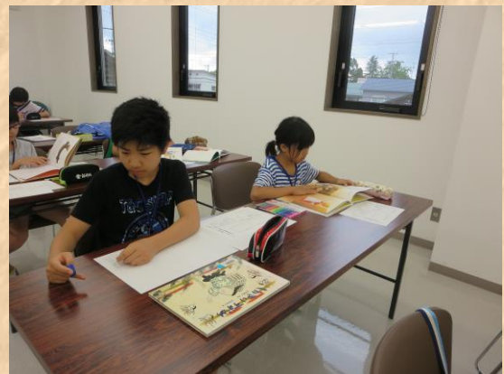
◎どんなお話にしようかな？