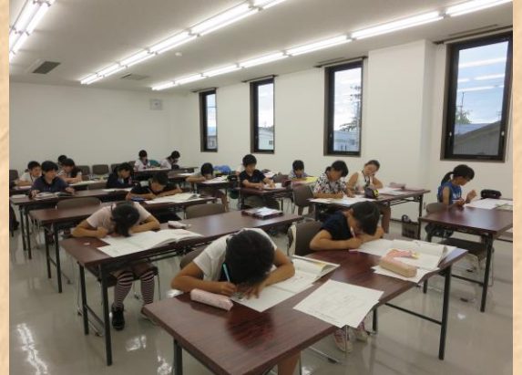
◎手作り絵本の作成中

じゆこうせい 受講生には一冊 いっさつえほん 絵本を選んでもらい、それをもとに さぎょう 作業 おこな を行いました。