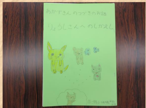
◎自分だけの絵本の完成です

かな 悲しい話 はなし のつづきを あか 明るくまとめたり、 とっぴょうし 突拍子もない ところ 所からつづきのお話 はなし が う 生まれたり、 そうぞうりよくた 想像力豊かに おんかい お話を さくせい 作成していました。 ぶんしやう 文章と え 絵が さいご できたら、最後に と ページを じぶん ホッチキスで えほん 閉じて、自分だけの絵本の かんせい 完成です。 ぜんいん 全員とても じょうず 上手に えほん 絵本を さくせい 作成することができました。この えほん 絵本は8月24日～ ちょうりつとしょかん 町立図書館で てんじ 展示します。